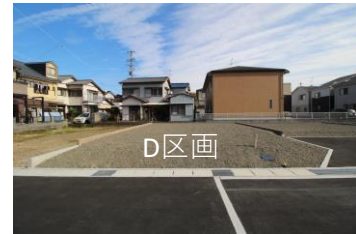
D区画 面積：148.19㎡ (44.83坪) 価格：14,000,000円