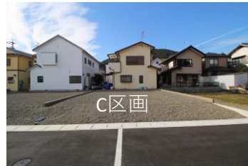
C区画 面積：116.50㎡ (35.24坪) 価格：11,500,000円