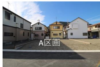
A区画 面積：116.50㎡ (35.24坪) 価格：11,500,000円