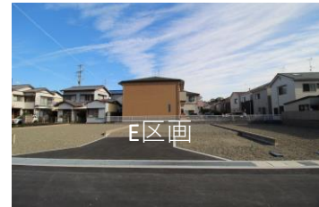
E区画 面積：116.90㎡ (35.36坪) 価格：10,800,000円