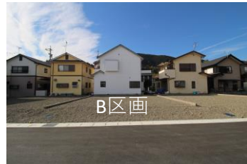
B区画 面積：116.49㎡ (35.24坪) 価格：11,500,000円