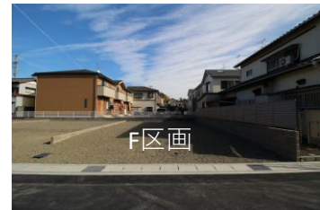
F区画 面積：125.31㎡ (37.91坪) 価格：12,300,000円