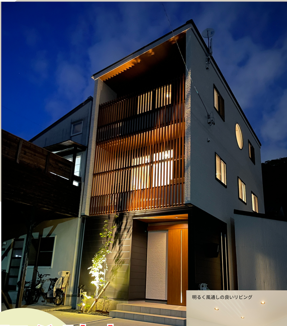
明るく風通しの良いリビング